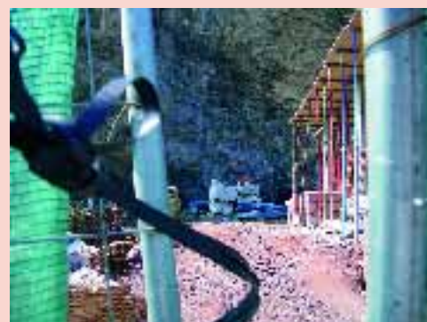
Foto 1: la obra en sus inicios Foto 2-4: estado actual de la obra Sobre estas líneas: ficha de licencia