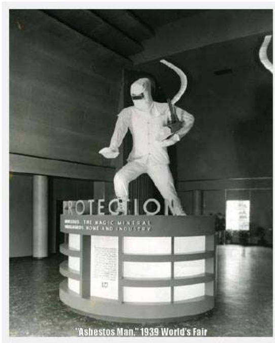
“Asbestos Man”, “The magic mineral. Exposición Internacional de N. York, 1939.

“¿Todo el océano inmenso de Neptuno podría lavar esta sangre de mis manos? ¡No! Más bien mis manos colorearían la multitudinosa mar, volviendo rojo lo verde!” (Macbeth: Acto II, escena II) 1